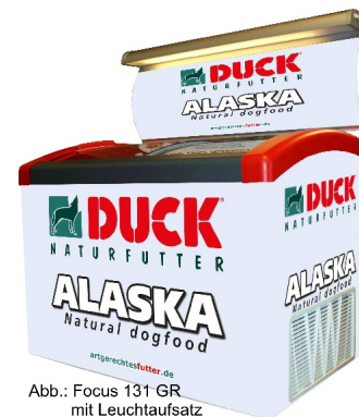
Abb.: Focus 131 GR mit Leuchtaufsatz